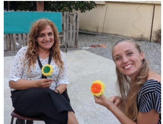
We komen onderweg soms mooie dingen tegen