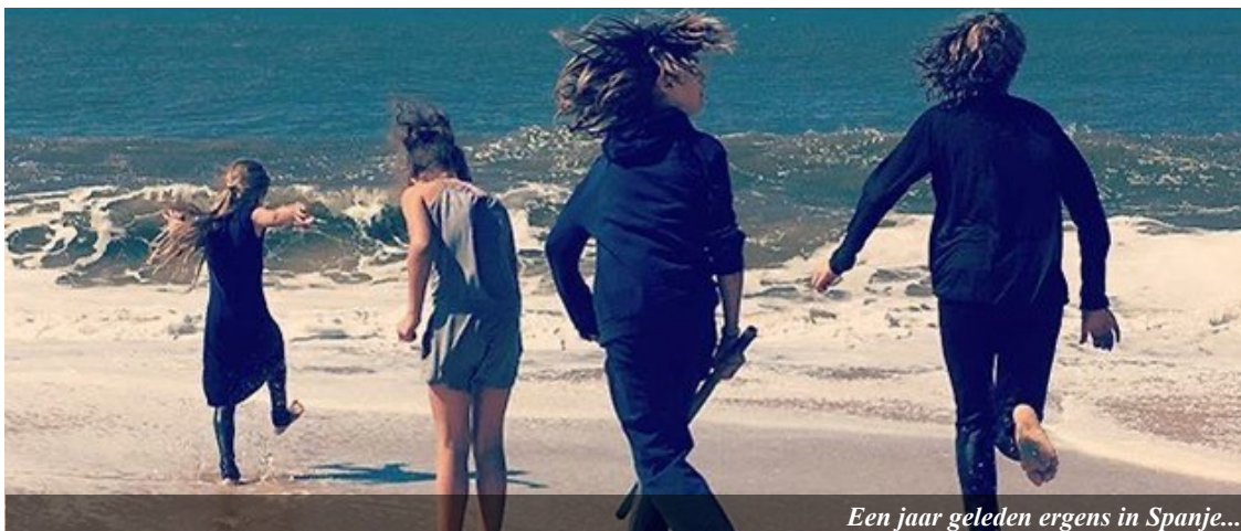
Een jaar geleden ergens in Spanje...

Naast het vormen van het TFT, zijn we bezig om ons fonds op te bouwen. Dit betekent dat we mensen aan het benaderen zijn met de vraag of ze ons werk in Spanje (ook) financieel willen gaan ondersteunen. We weten dat we op Gods voorziening mogen vertrouwen en worden nu ook uitgedaagd om verantwoordelijkheid te nemen om dat bekend te maken bij mensen om ons heen zodat het werk in Spanje ook breed gedragen zal worden.